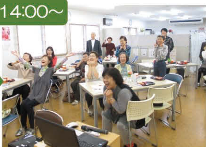
気軽にできる脳トレーニングの時間は大盛り上がり!