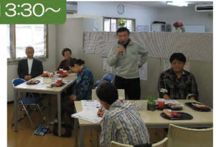
みなさまから自己紹介