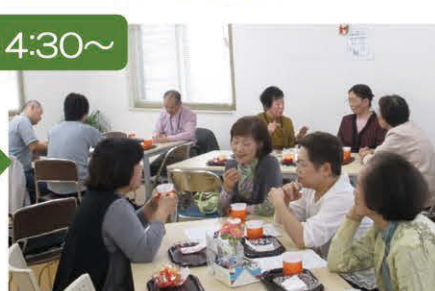
最後は茶話会でお話を楽しまれました。