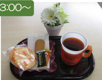
当日のお茶菓子です。