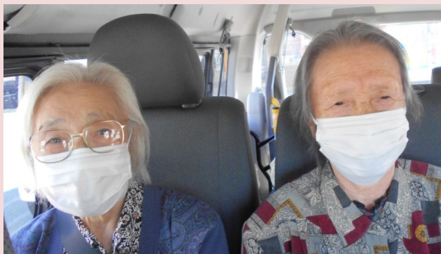
天気にも恵まれ、絶好の ドライブ日和でした！