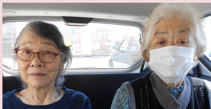
ドライブに行ってきました～！ おやつは大判焼きです。